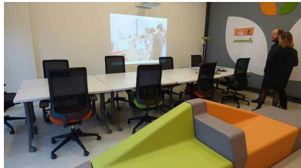
Espace Vitamines (Bayeux Intercom)