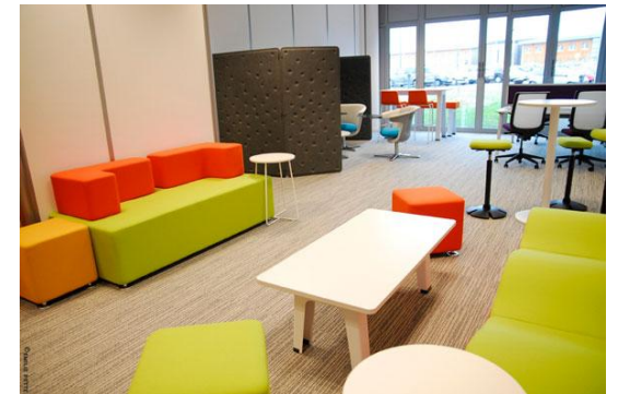
Forum Digital (Caen)